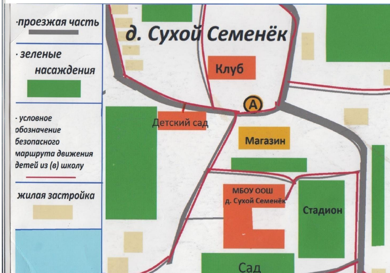
Схема безопасного маршрута детей МБОУ ОШ д.Сухой Семенёк из школы в столовую (детский сад)

Схема движения из МБОУ ОШ д.Сухой Семенёк в столовую